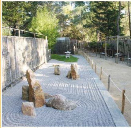
JARDIN SEC ZEN "KARE SANSUI"

DES ZONES AVEC DES BANCS SONT PRÉVUES SOUS L'OMBRE FRAÎCHE DE PINS ET CHÊNES VERTS CENTENAIRES.