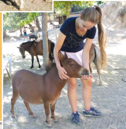
DOLLY, LA PLUS PETITE MULE DU MONDE !