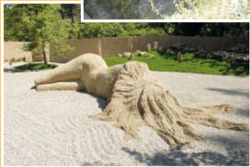
JARDIN DE LA BELLE ENDORMIE