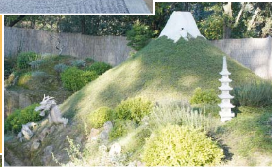
JARDIN DU MONT FUJI